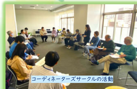
コーディネーターズサークルの活動