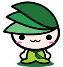
緑区イメージキャラクター 「ミウル」

※3 パンフレットは、まちづくりセンター、リフレッシュセンターに置いてあります。 また、自治会長や民生委員のお宅にもございますのでお尋ねください。