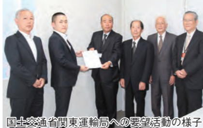
国土交通省関東運輸局への要望活動の様子