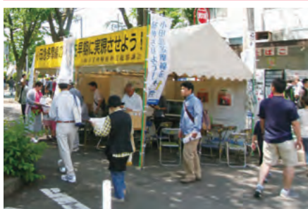
「市民若葉まつり」でのブースの様子