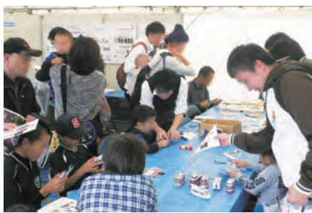
「潤水都市さがみはらフェスタ」でのブースの様子