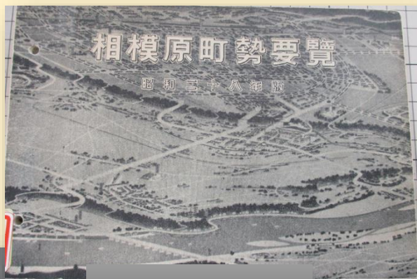
相模原町勢要覧【保存行政資料】