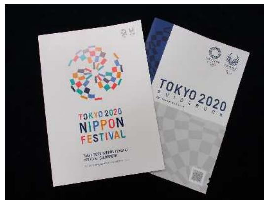
NIPPONフェスティバルブック・大会ガイドブック